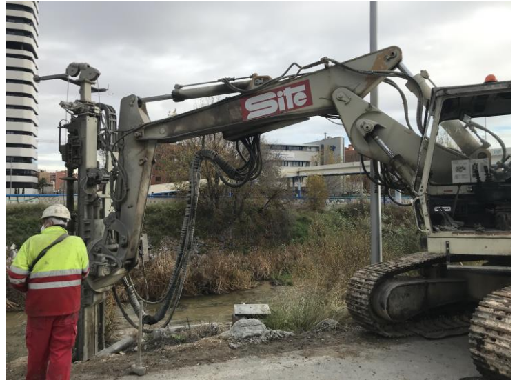
Imagen 1. Ejecución micropilotes.

En diciembre de 2020 se le encargó a SITE S.A. la realización de 1040 metros lineales de micropilotes de diámetro 200 mm armado con armadura de acero tipo N-80 de diámetro y espesor 139,7/9 mm de acero tipo N-80 o similar, de profundidad variable en función del empotramiento. El método utilizado fue de inyección global única (IGU), con lechada de cemento 42,5 SR. Se inyectaron 14tn de materia de cemento en exceso. Obra terminada marzo 2021.