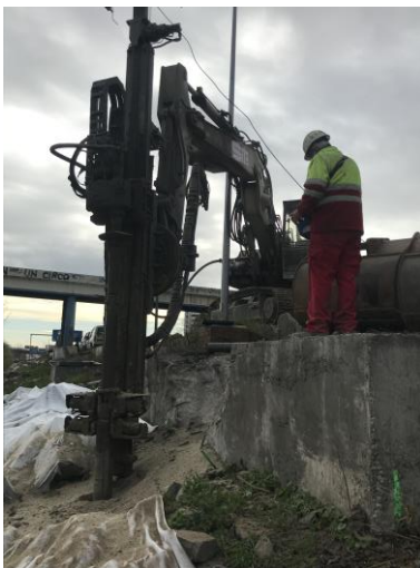
Imagen 2. Ejecución micropilotes.