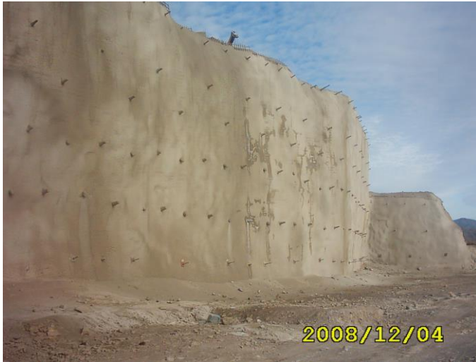
Vista general de parte del talud con los trabajos de sostenimiento finalizados.