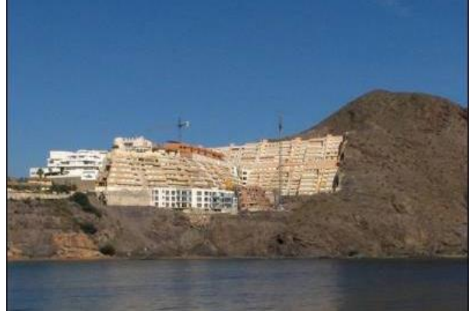
Nuevas construcciones de apartamentos turísticos.