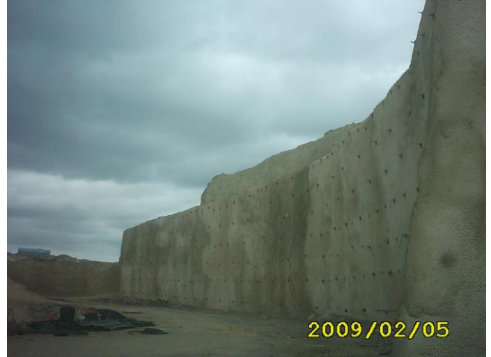
Vista general de parte del talud con los trabajos de sostenimiento finalizados.