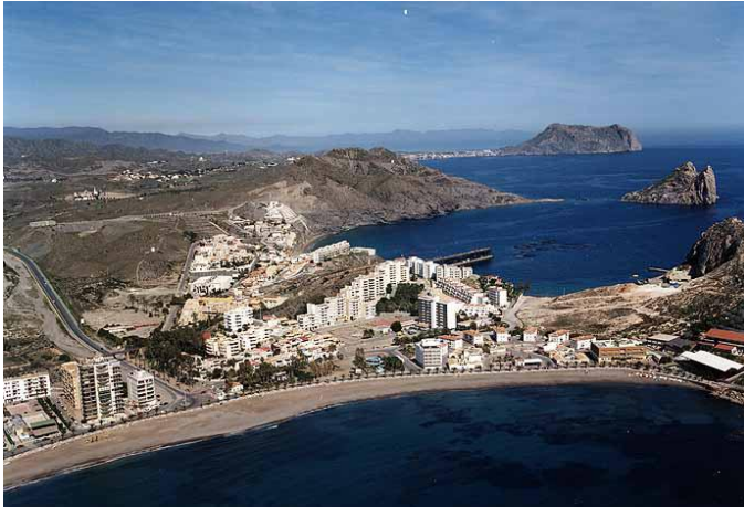
Vista aérea de la población de Águilas.