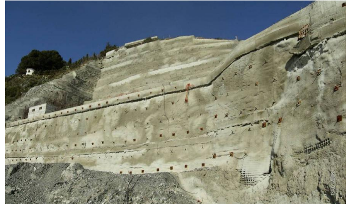
Vista general del desmonte.