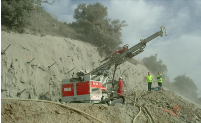
Comacchio MC800 perforando bulones.

BAHÍA FENICIA S.L. UTE PEÑÓN DEL LOBO (SITE) ESTABILIZACIÓN DE TALUDES – SOIL NAILING