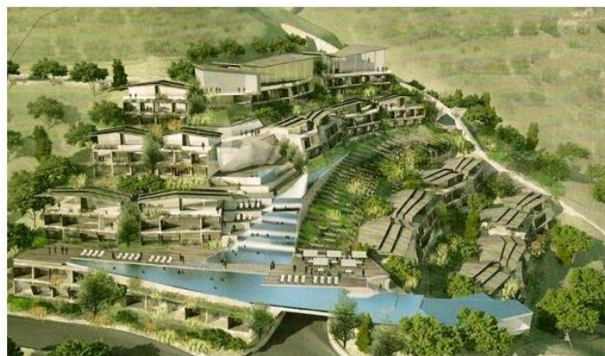
Ilustración del proyecto urbanístico de lujo Peñón del Lobo (Almuñecar – Granada).