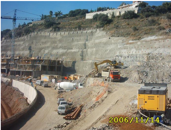
Inicio de los trabajos de construcción de las nuevas viviendas.