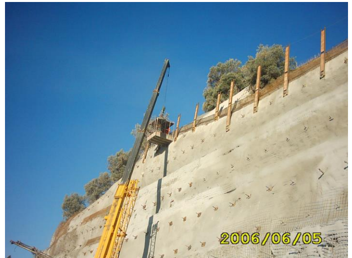
Ejecución de trabajos en altura desde jaula perforadora.